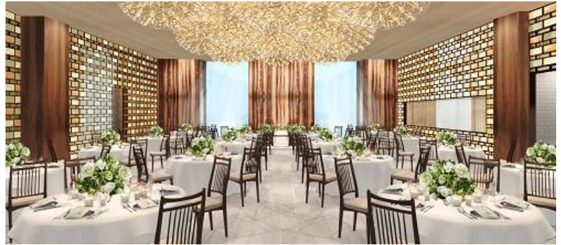
▲アンティークガラスの壁面やオープンキッチンを併設した110名着席できるパーティ会場/完成予想図