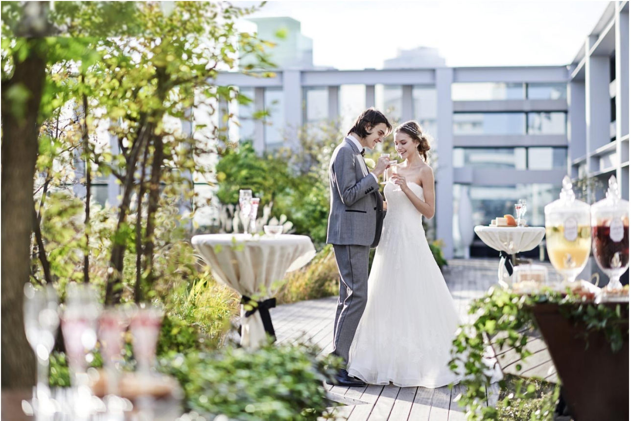
▲写真はイメージです

ハウスウエディング事業を展開する株式会社ブラス（本社：愛知県名古屋市、代表取締役社長：河合達明、以下当社）は、大阪府大阪市北区に新たに建設されたビル「OSAKA UK・GATE」最上階に、完全貸切ゲストハウス「ブランリール大阪」を、平成 29 年 3 月 19 日にグランドオープンいたします。