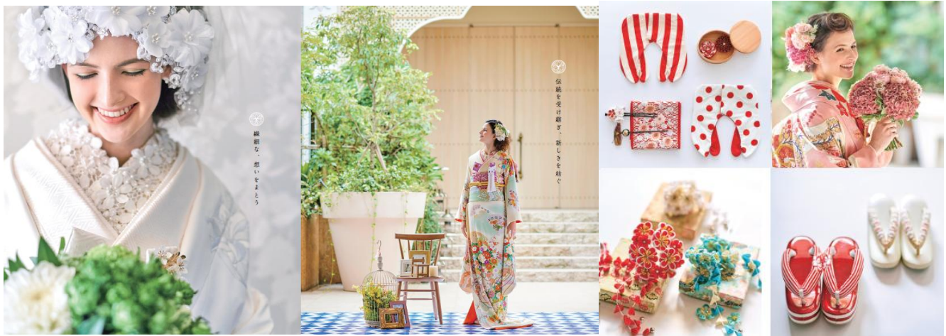
▲『翔風館』でご提案できる白無垢・色打掛・引き振袖などの着物や小物、コーディネートの一例