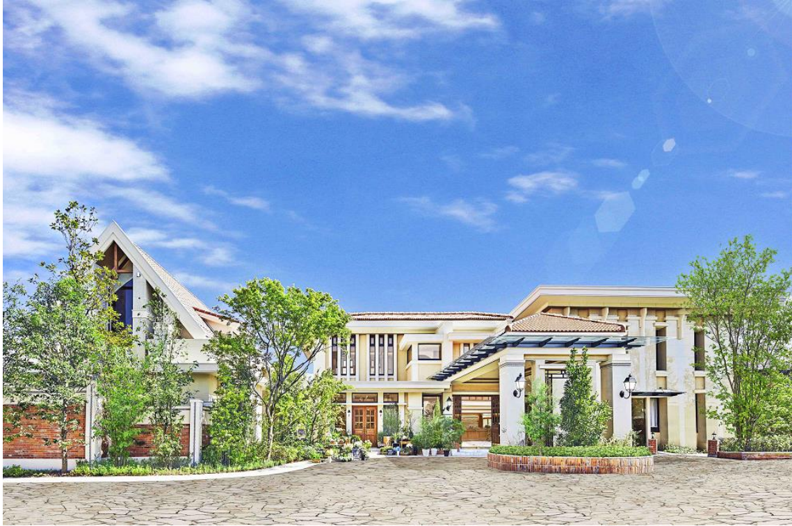
▲森の邸宅を思わせる一軒家貸切型のゲストハウス/完成予想図

のチャペルや、プールのある広々としたガーデン、木目調が優しいパーティ会場など、四季の緑を感じる空間が魅力です。なお、100名規模が可能な貸切型の結婚式場としては、浜松エリアでは約5年ぶりの新規出店となります。他には類を見ない、緑と木の温もりに包まれた貸切邸宅で叶えるオリジナルウエディングは、浜松のウエディングシーンに新しい風を吹き込むこと間違いなしです。