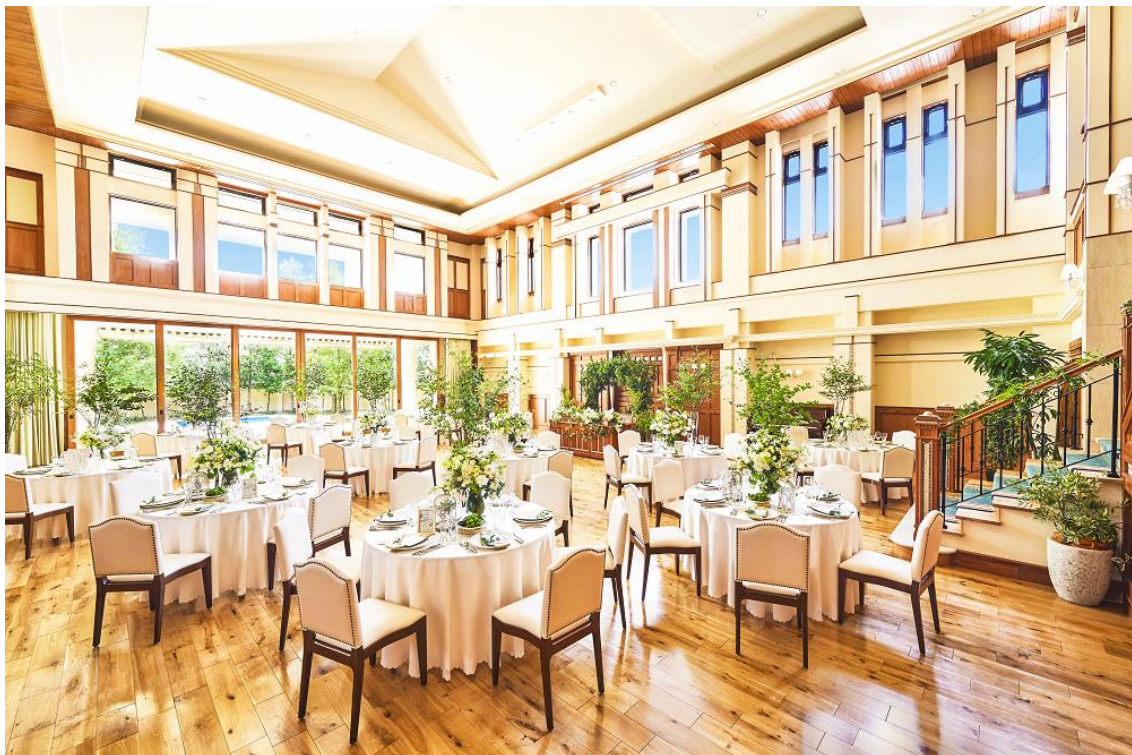
▲ガーデンに面したパーティ会場はゲストもゆったり過ごせる広さ（130名着席）／完成予想図