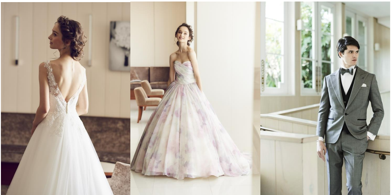
▲大胆なカッティングと繊細な刺繍が魅力のブラスオリジナルドレス（写真左）